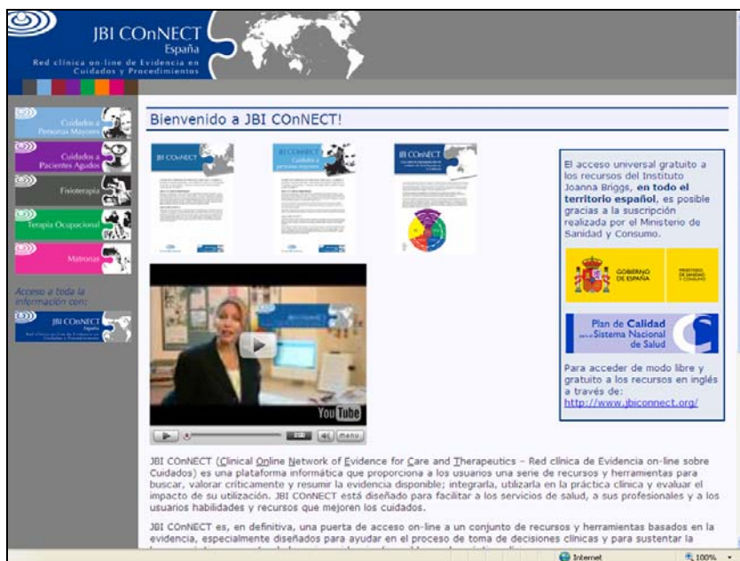
Pantalla inicial de la Web JBIconNECT ( http://es.jbiconnect.org/ )

Desde el pasado 15 de noviembre es posible el acceso en español a los recursos del Joanna Briggs Institute australiano gracias a la suscripción realizada por el Ministerio de Sanidad y Consumo. El acceso a JBI ConNECT está disponible en la dirección http://es.jbiconnect.org/ .